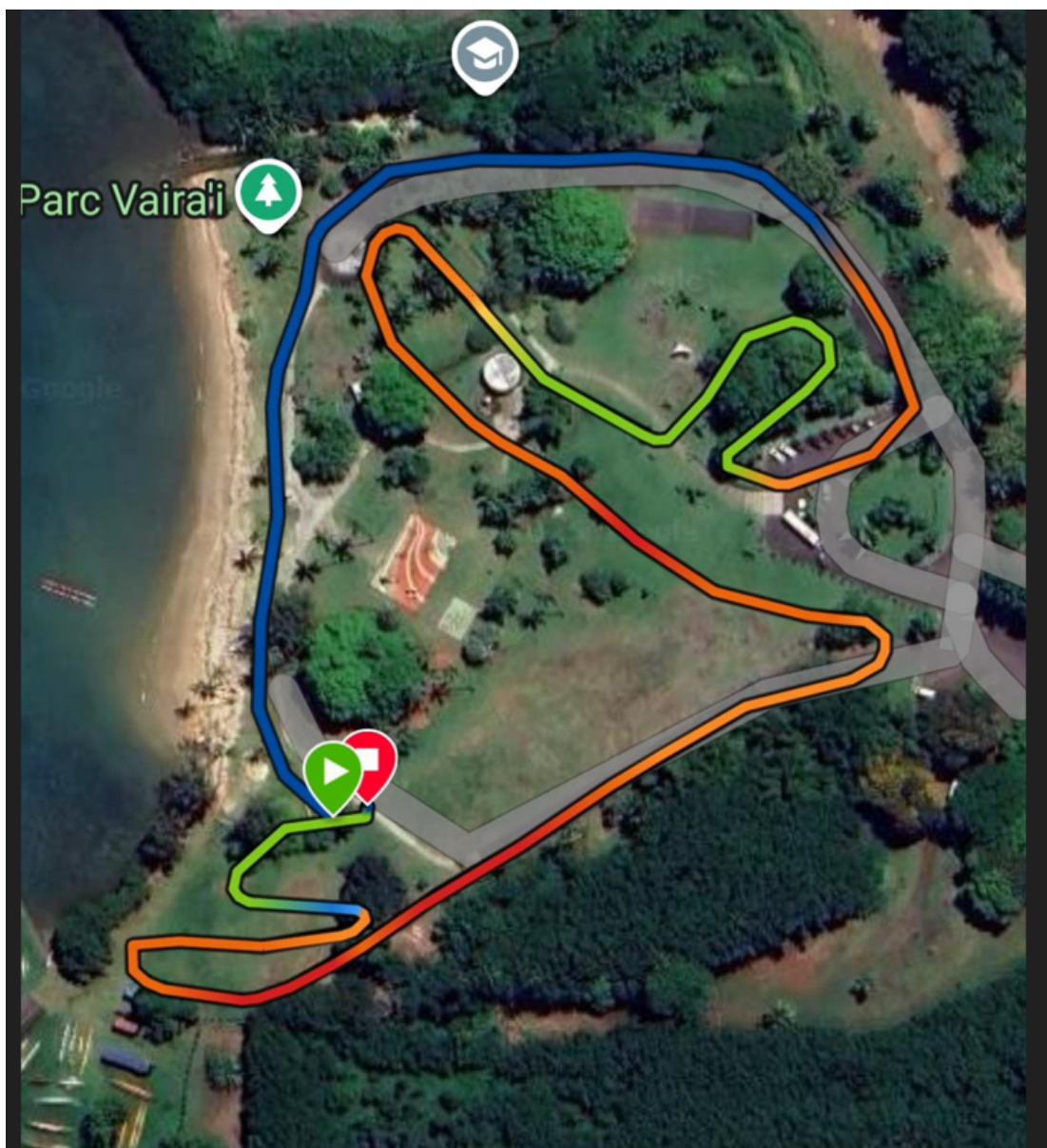
Parcours VTT S-XS